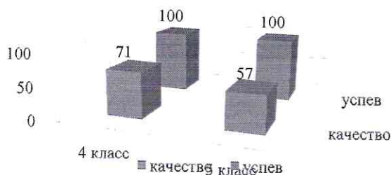
Диаграмма 1. Сравнительный график результатов итоговой аттестации в 4 классе за прошлый учебный год и результатов стартовой диагностической работы в 5 классе за 2022/23 учебный год